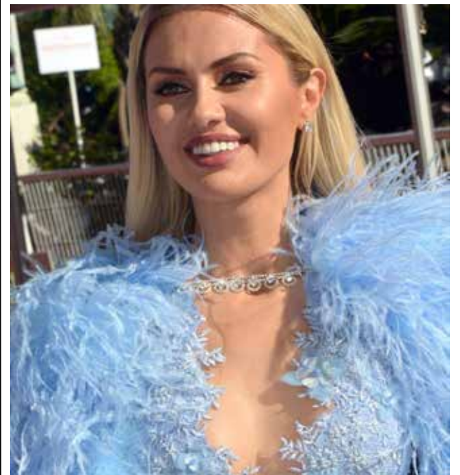
Victoria Bonya.

Creative Commons Attribution-Share Alike 3.0